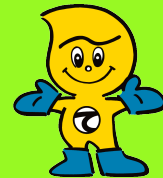
産業廃棄物処理のマスター 「てき丸君」